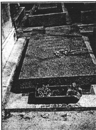
Tombeau de S. Beckett

*Source : Theatre Research International , vol. 24, n° 3, 1999.