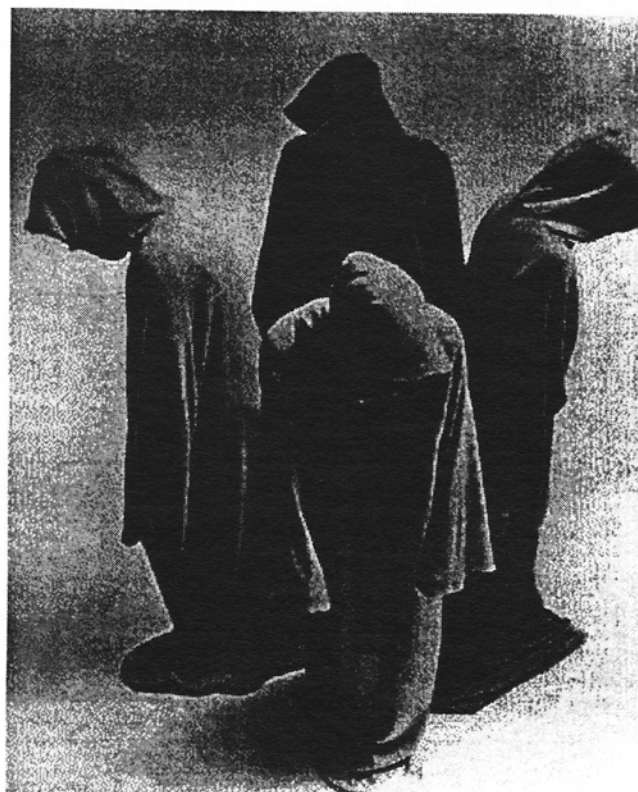
Quad 1 de Samuel Beckett (New York, 1997)